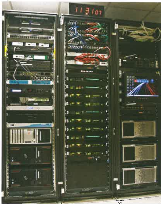
Sanef 107.7, CDM, vue d'ensemble des 3 baies.

Avec une réactivité immédiate « en cas d'incident grave sur un secteur on permute complètement les studios : on peut ainsi raccrocher par exemple l'est et l'ouest ensemble pour libérer un studio dédié au réseau nord. Il y a toujours un cadre et un présentateur d'astreinte la nuit et le week-end », précise Maxime Paillé.