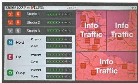
Sanef 107.7, écran montrant l'activité des trois studios.

La spécificité de Sanef 107.7 est d'être avant tout une radio d'info trafic, mais également une radio généraliste, avec une programmation musicale adulte pop/rock faite de nouveautés et de grands titres incontournables, adaptée à la mobilité. Une équipe Mediameeting d'une vingtaine de professionnels de la radio diffuse un véritable programme — chroniques cinéma, musique, gastronomie et autres, flashes infos, etc. Sanef 107.7 réalise aussi des reportages de terrain (par exemple, récemment, au Salon de l'Agriculture à Paris), et depuis le 2 mars des reporters en région font partager les « coups de cœur des libraires » ou convient les auditeurs sur « la route des saveurs », en partenariat avec les guides « Le Petit Futé ».